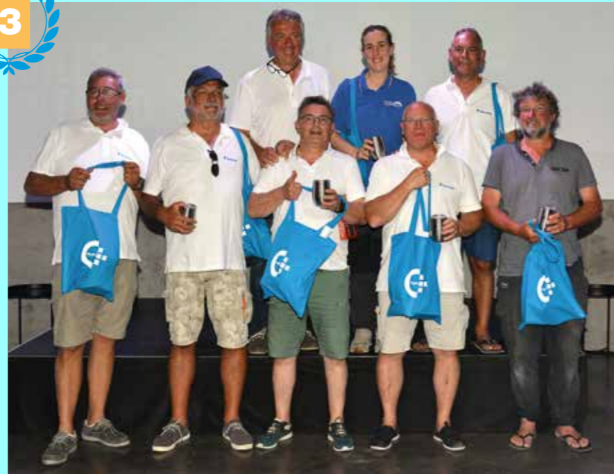
3 e prix : ClimaFroid Concept