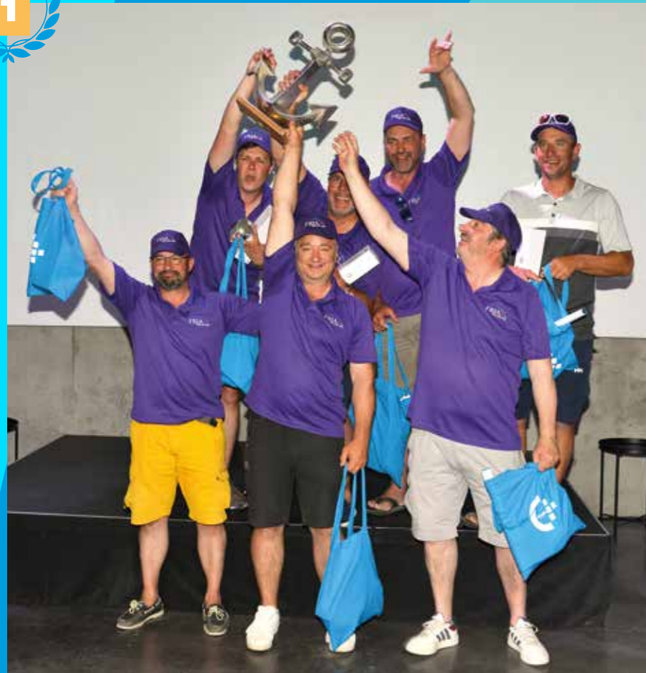
1 er prix : Friax