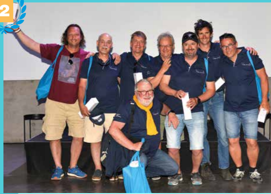
2 e prix : Les Experts